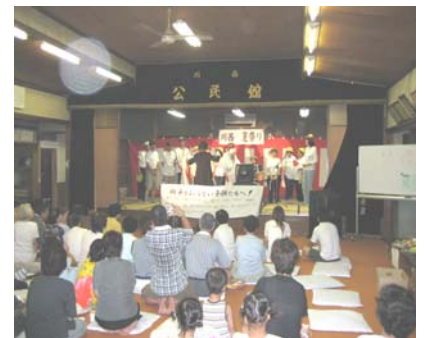
〔アイデア賞: 新田組〕