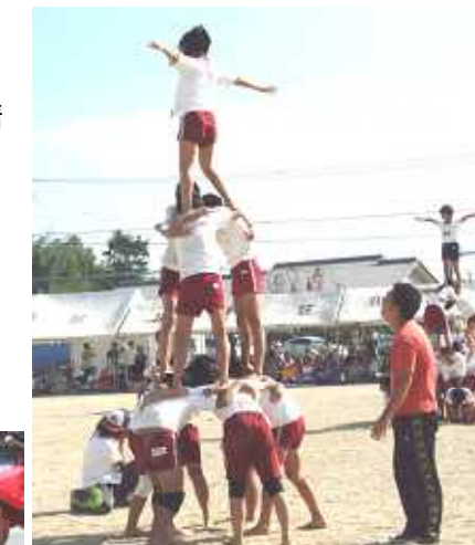
5・6 年生の『宇宙へ! 未来へ!』