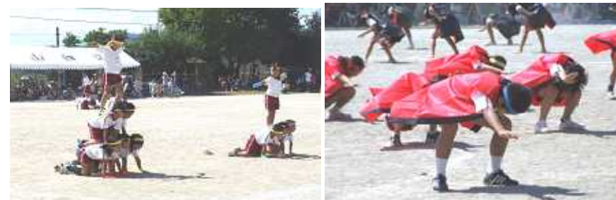
1・2 年生の『Go/Go! ピラミッド』 3・4 年生の『どっこいしょソーラン 2009』

徒競走、低・中・高学年リレー、表現運動、全校児童の綱引き・さくら会競技『まあ! 4 (フォー) のじゅうたん』、色別応援など、子どもたちは家族や地域の人々の声援を受けながら精一杯演技していました。特に表現運動では、繰り返し練習した成果を発揮することができました。